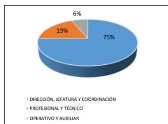
GRÁFICO Nº 1 ESTRATO DEL CARGO